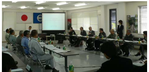
日之影町役場研修館で行われた五ヶ瀬川水系河川整備計画検討委員会