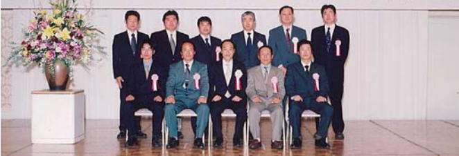
受賞者と東国原知事との記念撮影