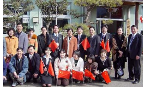
高千穂小学校の先生と記念撮影する視察団

視察団の感想は、非常に好評であり、今後、中国からの修学旅行が増加することが期待されます。