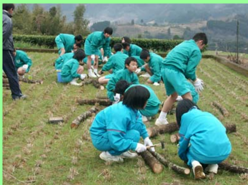
駒打ち込みを行う日之影中学校と八戸中学校の生徒

しいたけ原木に、穴あけ機や電気ドリルで穴を開けた後、種駒打ち込み体験を実施しました。