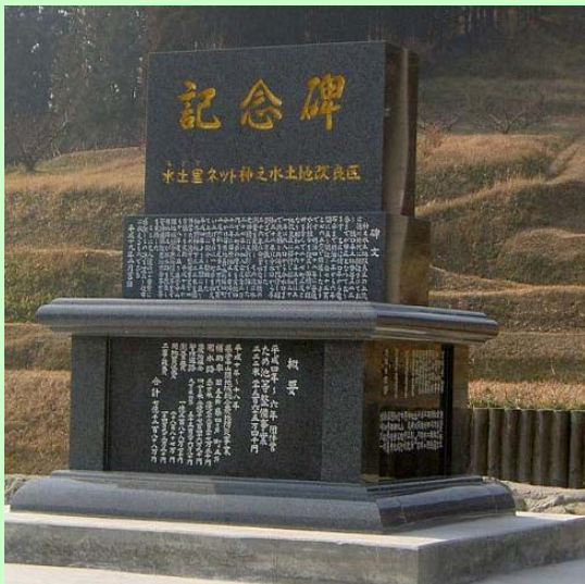
上野地区県営中山間地域総合農地防災事業完成の記念碑

高千穂町の上野地区県営中山間地域総合農地防災事業は、平成10年度から事業に着手し9ヶ年の歳月をかけて、19年3月に完成し、3月1日に竣工式が行われました。