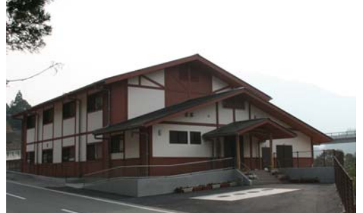
水ヶ崎大橋の近くに整備された「田植え踊り館」

同地区の伝統芸能「田植え踊り」の伝承施設として期待されます。総事業費は、1億427万円。約50%が国庫補助金。