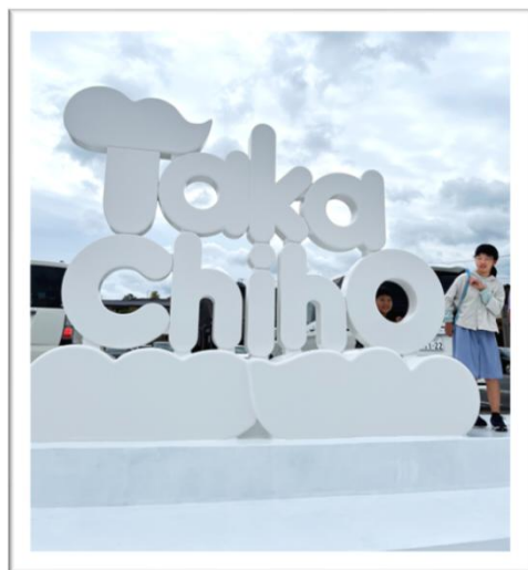
モコモコ感いっぱいのオブジェ