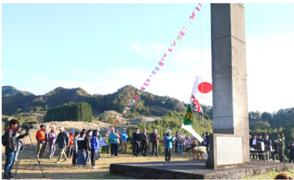
ウェストン祭の様子

11月3日に、日本近代登山の父として知られる英国人宣教師ウォルター・ウェストン師の功績を偲ぶ「第38回宮崎ウェストン祭」が高千穂町五ヶ所高原三秀台ひめゆり公園で開催。登山愛好家や地元住民を含む、およそ100名が参加し、ウェストン師の偉大な功績をたたえとともに、山岳遭難者への追悼と、登山の安全祈願が行われました。山々に囲まれる高千穂郷の安全な登山と、豊かな自然への感謝を育む貴重な機会となりました。