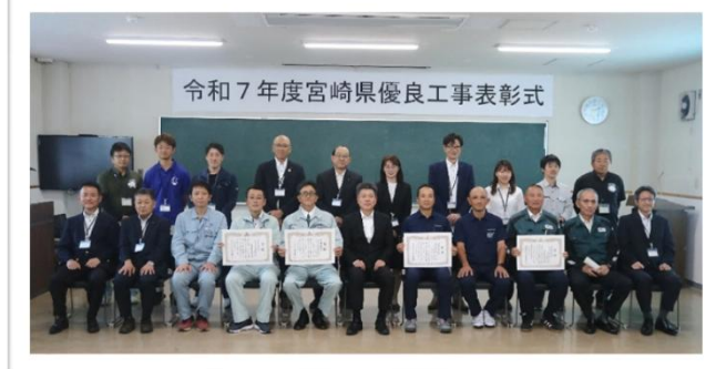
表彰された業者の皆さん