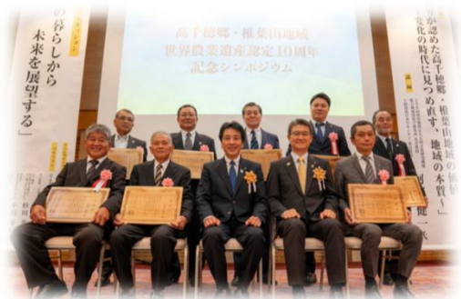
功労者表彰及び感謝状贈呈を受けた方々の記念写真