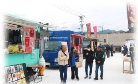
キッチンカーもやってきました

11月1日に、高千穂町のがまだせ市場の隣で「SITE MITAI（サイトミタイ）」の完成記念イベントが開催されました。SITE MITAIは、地元住民の皆様や高千穂を訪れる観光客の方々が自由に立ち寄れる憩いの場です。月に1回程度を目標にイベント会場としても貸し出され、町のにぎわい創出や地域交流の拠点となることを目指しています。広場のデザインは、高千穂で秋から初冬にかけて見られる雲海がモチーフで、ベンチやあずまや、舗装路面などが白く、丸みを帯びたデザインで統一されています。高千穂の新しい顔として誕生した