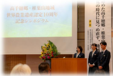
GIAHSアカデミー代表者の皆さん

中等教育学校の生徒たちによる山腹用水路の歴史や特徴の紹介に加え、同校と高千穂高校の生徒たちで構成するGIAHSアカデミーの代表らが世界農業遺産を将来に引き継ぐためのユース宣言も行いました。