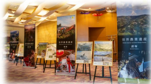
様々な活動がパネルで紹介されました

10月31日に、焼畑や神楽など伝統が息づく「高千穂郷・椎葉山地域」の世界農業遺産認定10周年を記念し、ホテル高千穂でシンポジウムが開催されました。管内外からおよそ200名が参加し、功労者表彰や感謝状贈呈が行われたほか、五ヶ瀬