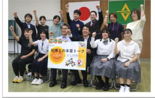
本音トーク参加者の皆さん