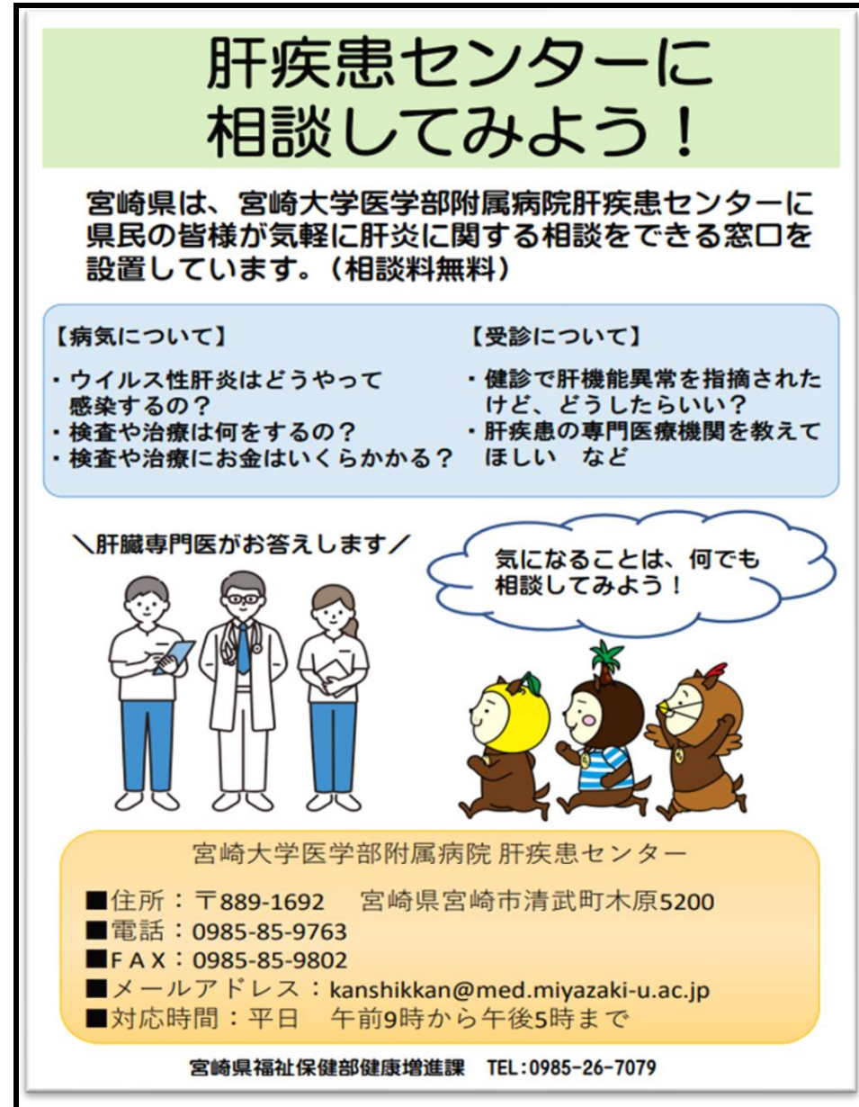
図2：肝疾患センター案内リーフレット