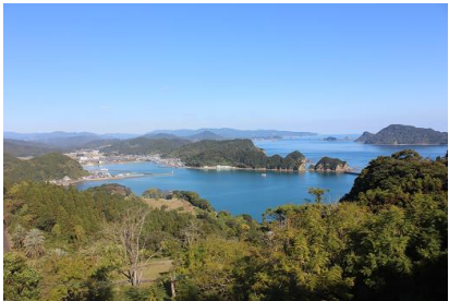
NO- 6地点 〔風に揺れるジャカラングがいいね！〕