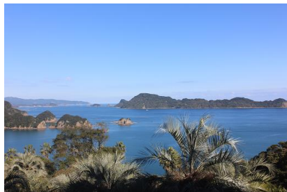
NO- 12地点 〔ムクロジの木を背にしたスポット〕