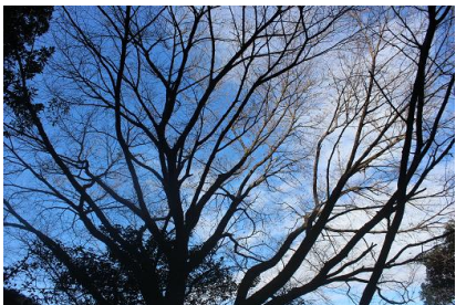
NO- 11地点 〔こ、これは「すごい」山桜の大木！〕