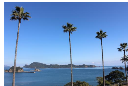
NO- 19地点 〔道の駅絶景ポイント〕