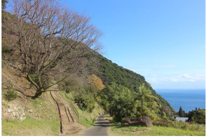
NO- 1地点 〔山桜と太平洋の望める丘〕