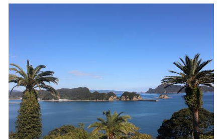
NO- 20地点 〔フェニックスの間から見る島々〕