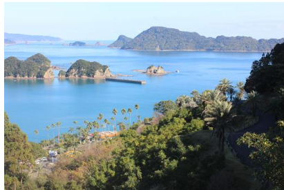
NO- 7地点 〔腕島が『メイン』かな？〕