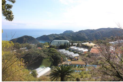
NO- 2地点 〔亜熱帯作物支場の展望デッキ跡〕