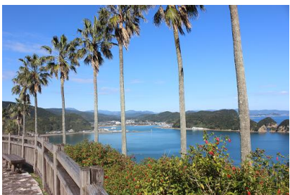
NO- 16地点 〔南国ですね！ヤシの木が揺れてます〕