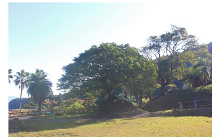
NO- 15地点 〔石の上にも何十年？〕