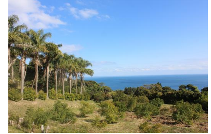
NO- 5地点 〔「女王」ヤシと海、そしてジャカラング畑〕