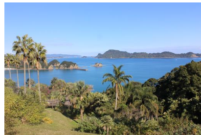
NO- 13地点 〔宮崎県で一番大きな島が大島です〕