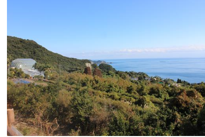
NO- 4地点 〔原生林から顔をだすトロピカルドーム〕