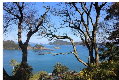
NO- 18地点 〔生い茂る木の間から見る日南海中公園〕