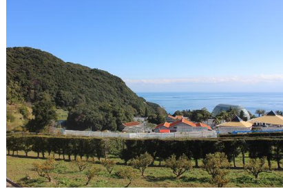
NO- 3地点 〔空と海と原生林と亜熱帯作物支場〕