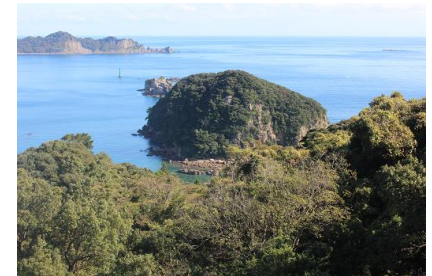
NO- 10地点 〔黒島の絶景ポイント〕