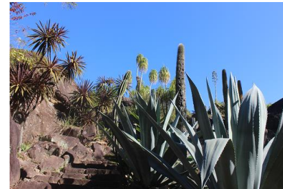
NO- 9地点 〔天然岩の山、色んなビューが隠れてます〕