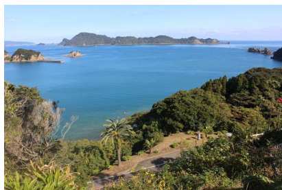
NO- 17地点 〔全国一位がうなずけるながめです〕