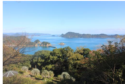
NO- 8地点 〔日南海中公園パノラマビュースポット〕