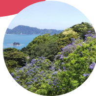
道の駅なんごう応援団 ジャカランドプロジェクト