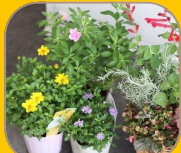
どう組み合わせる? 寄植体験