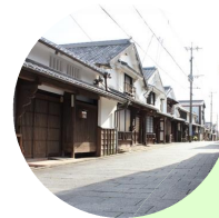
美々津の歴史的 町並みを守る会