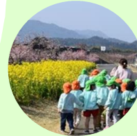
NPO法人コノハナロード 延岡市民応援隊