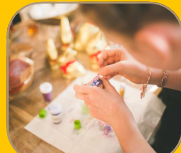
木の实を使った 手作りワークショップ