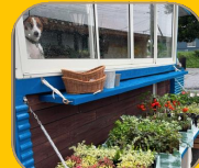
花苗の選び方について学ぼう!