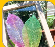
葉っぱの フォトフレーム作り