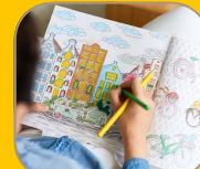
宮崎の美しい景観 塗り絵コーナー