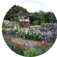
こどものくにガーデン ときどき花くらぶ