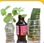
水挿しについて 楽しく学ぼう!