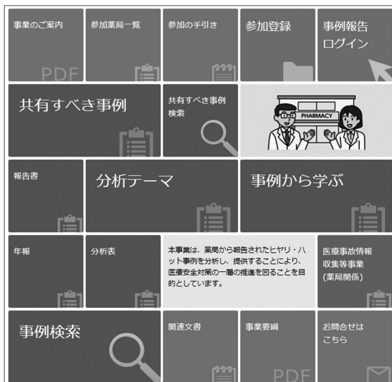
図表IV-1 ホームページのトップ画面

本事業では、事業計画に基づいて、報告書や年報、共有すべき事例、事例から学ぶなどの成果物や、匿名化した報告事例などを公表している。本事業の事業内容の掲載情報については、パンフレット「事業のご案内」に分かりやすくまとめているので参考にいただきたい ( https://www.yakkyokuhiyari.jcqhc.or.jp/pdf/project_guidance.pdf )。