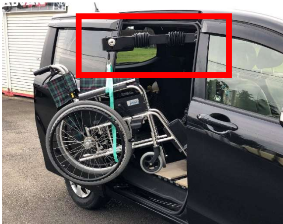
⑤車イス等からの移動が安全にできるようになる設備