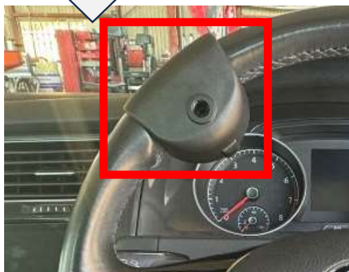
↑指が全部欠損している方向けの設備