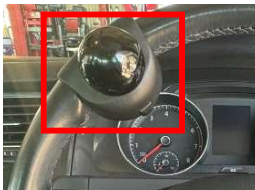
↑指が一部欠損している方向けの設備