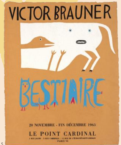
1. ジュール・シェレ《マリアーニ・ワイン》(1894) 2. アドルフ・カッサンドル《北方急行》(1927) © www.cassandre.fr APPROVAL by the ESTATE OF A.M. CASSANDRE / JASPAR 2024 E5676 3. マン・レイ《ロサンゼルス・カウンティ美術館での展覧会》(1966) © MAN RAY 2015 TRUST / ADAGP, Paris & JASPAR, Tokyo, 2024 E5676 4. アルフォンス・ミュシャ《第20回サロン・デ・サン(白選展)》(1896) 5. ヴィクトル・ブローネル《「動物寓話」展、ル・ボアン・カルディナル画廊》(1963)

古代ローマ時代から存在したといわれるポスターは、時代を経て印刷技術の進歩とともに急速な発展を遂げていきました。広告媒体であるポスターに、新たな表現の可能性を見いだした芸術家たちは、互いに競い合うように、観る人の印象に残る想像力に満ちた作品を創り出しました。19世紀後半のパリでは、シェレやロートレック、ミュシャらが人気ポスター画家として活躍しました。パリの外壁は様々なポスターで彩られ、自由で新しい表現は興隆を極めました。それは、ポスターが単なる商業用告知物にとどまらず、新たな芸術様式となる幕開けでもありました。20世紀になると、ピカソ、マティス、シャガール、ミロなどの巨匠たちが、自身の個展の宣伝やイベントの告知のためにオリジナルのポスターを制作しました。本展では、ポスター芸術の確立とその後の展開を、約160点の作品でたどります。色鮮やかで心躍るポスターたちの競演をお楽しみください。