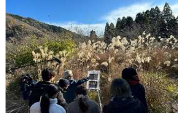
1-(1) 大学生が参加した「土呂久を学ぶ フィールドワーク」