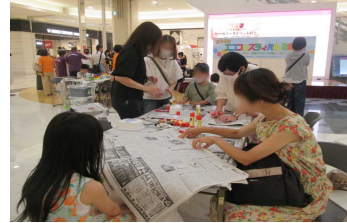
2-(2) 環境保全に関する普及啓発イベント 「みやざきエコフェスティバル2023」