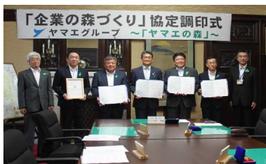
3-(1) 「企業の森づくり」協定調印式