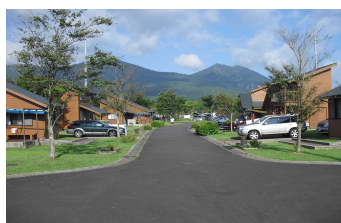
4-1) ひなもり台県民ふれあいの森 キャビン棟(管理運営)