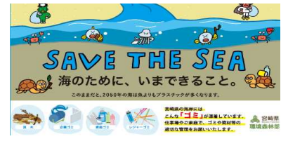
2-(1) 海岸漂着物等発生抑制対策事業 における啓発CM