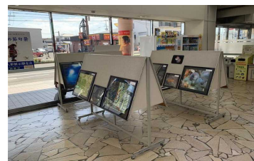
3-3) 「日南海岸のサンゴといきもの」写真展 (宮崎市)