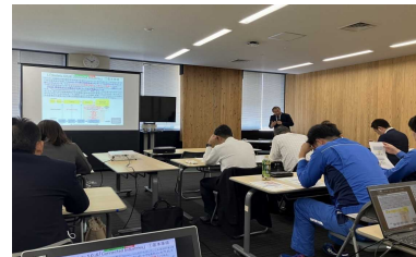
1-(2)(3) 事業者向け再エネセミナー