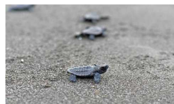
2-(2) 県指定天然記念物 「アカウミガメ及びその産卵地」