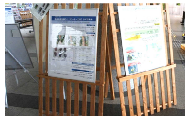
4-(1) 農水産業への温暖化の影響と対応策の 取組に関する研究成果パネル展示