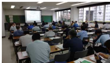
1-(3) 産業廃棄物排出事業者講習会