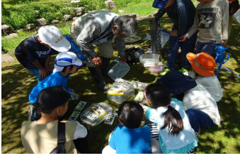
1-(1) 環境情報センターにおける環境講座