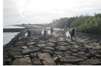
2-(2) 県民総ぐるみで行う環境美化活動 「クリーンアップ宮崎」