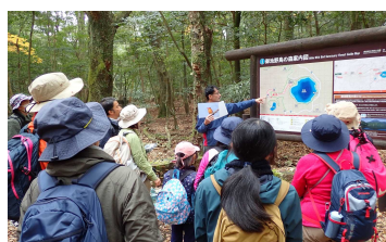
4-1) 初心者向けハイキング教室(高原町)