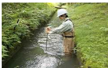
2-(1) 農業用水を利用した 小水力発電の可能性調査