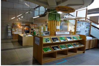
1-(4) 環境情報センター