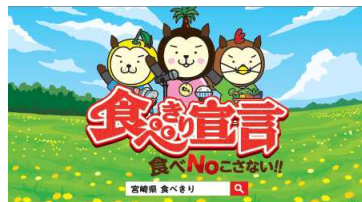
3-(2) 食べきり宣言プロジェクト における啓発CM