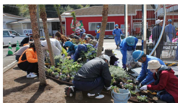
2-(1) ボランティア活動による 国道の植栽管理