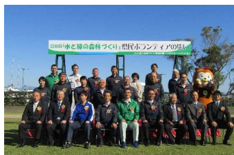
2-1) 「水と緑の森林づくり」 県民ボランティアの集い(宮崎市)