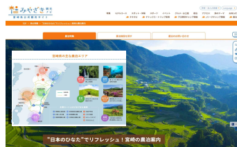
1-(4) 農泊サイトリニューアル