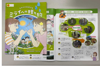
1-(1) 環境教育用パンフレット 「みやざき環境読本」