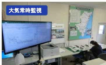
1-(1) 大気汚染状況常時監視