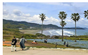
4-1) 日豊海岸国定公園 金ヶ浜園地(日向市)