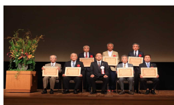
2-(1) 第7回「美しい宮崎づくり」のつどい