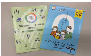
1-(1) ひなたゼロカーボン2050行動ブック