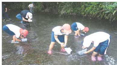
2-(3) 「五感を使った水辺環境指標」を用いた水辺環境調査