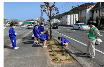
2-(1) 国道における植栽管理