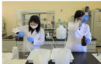
2-(1) 特定事業場排水検査