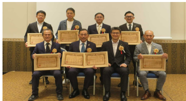
4-(1) みやざき木づかい県民会議(感謝状の贈呈)