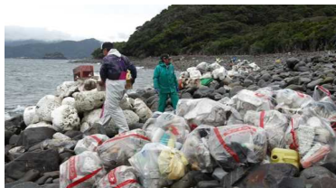
1-(5) 漁業者による漂着ゴミの清掃