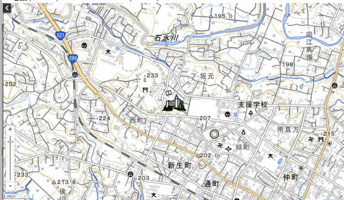
地理院タイルに所在地を追記して掲載