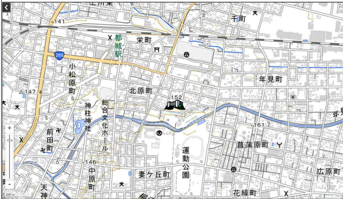
地理院タイルに所在地を追記して掲載