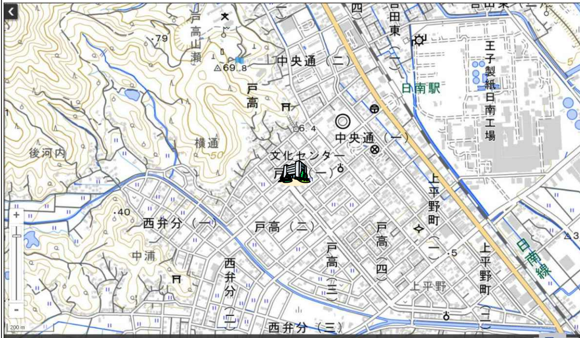
地理院タイルに所在地を追記して掲載