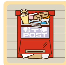
郵便物や新聞がポストに溜まっている。