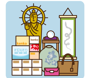
法外な高額商品や大量の健康食品などが置いてある。