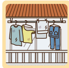
同じ洗濯物が干されたままの状態が続いている。