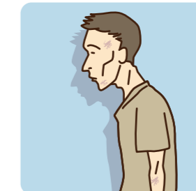
極端に痩せている、顔色が悪い、生気がない、不自然なアザが見られる。