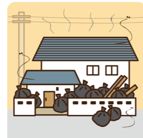
異臭・異音がする。