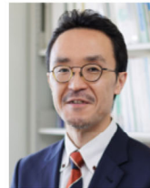
境 泉洋氏 宮崎大学 教育学部教授