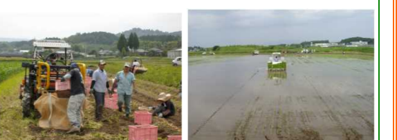
写真左: 水はけが良くなりジャガイモも収穫できました。写真右: 大型機械での農作業も楽々です。15年前の横市は、小さい面積で形の悪い田んぼで、道路も狭いため、大型機械での農作業ができず、後継者も育ちませんでした。

平成5年に横市河川改修にあわせて、ほ場整備工事を実施することになりました。形の悪い田んぼを縦100m、横60mの大きな区画の田んぼに整形しました。また用水路は管水路に改修し、いつでも安心して用水が使えるようにしました。排水路はコンクリートで整備され、道路は直線に配置し道幅も5.0m~7.0mと広くしました。