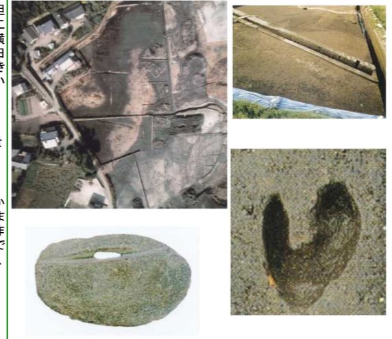
写真左上より/脇穴遺跡 鎌倉時代の水田畦 石包丁 牛の足跡