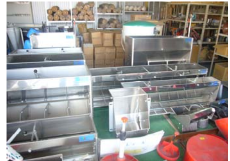
展示されている様々な製品

中でも、養豚用のエサ箱に関しては自社工場で、お客様の豚の飼い方に合わせた特注サイズによるオーダーメイドの製品を作っている。