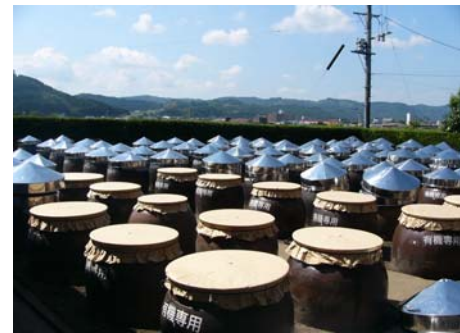
屋外にある約300個の巨大なカメ

製法・・・玄米酢は、創業時から変わらぬ「カメ仕込み」製法により、太陽と時の力で作り上げる。こんにゃくは、こんにゃく芋生玉と木灰汁を原料にした昔ながらの製造方法。