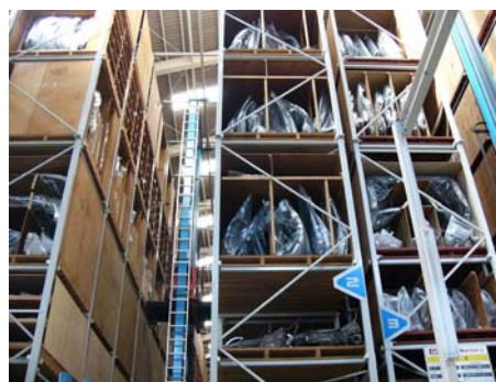
ITにより管理している中古部品

2001年に九州で初めての中古部品の自動倉庫を導入。コンピュータに商品の場所と入庫数を登録することで、約2万5千点の部品在庫について、正確な管理を行っており、国内はもとより、海外20カ国のユーザーへ部品を納品している。