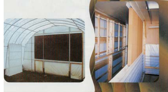
トンネルクールシステム

特殊加工を施したパッドと霧の組み合わせにより、手で触っても濡れない気化寸前の霧だけを畜舎内に取り込んで冷却する気化効率の良いシステム。