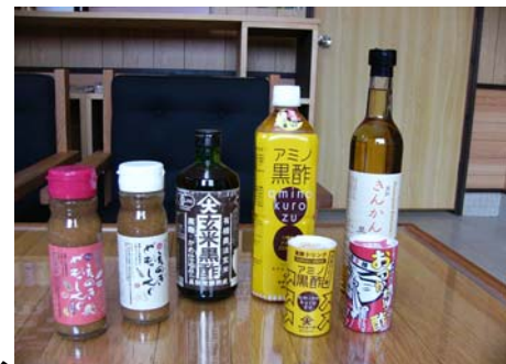
酢を使った様々な商品

焼酎醸造において発生する「焼酎粕」を有効利用して、17種類のアミノ酸が含まれた栄養価の高い黒酢ドリンク「アミノ黒酢」の研究開発に成功。「焼酎粕」の活用で環境にも優しい商品となっている。