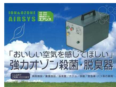
「強力オゾン殺菌・脱臭器」

宮崎県産オビスギ材の乾燥凝縮液を有効活用した製品の開発研究事業への参画、保育園などの砂場での利用を目的とした「抗菌砂」の開発など多数。