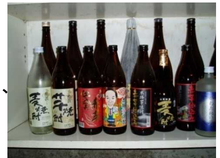
「ひむか寿」ほか主力商品

農畜産会社「チアフルカウズ」を立ち上げ、300頭余りに焼酎粕を未処理のまま与えて飼育している。肉質が向上すると共に、廃棄するしかなかった焼酎粕の有効活用につながっている。