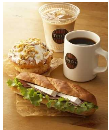
香り高いコーヒーと 豊富なサイドメニュー