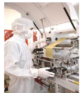
精密なスリット加工