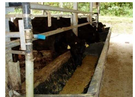
焼酎粕で育つ肉用牛