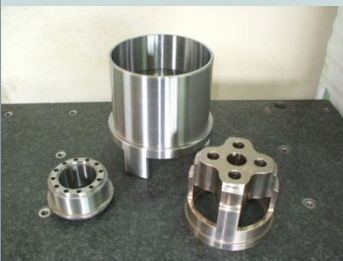
治工具(熱処理後研磨仕上げ)