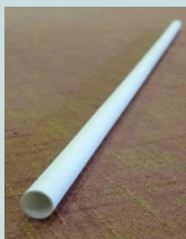
宮崎県で生まれた技術 (SPG膜精ろ過技術)