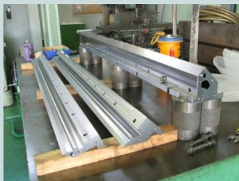
大型機械による切削加工品