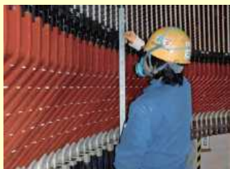
発電所設備の点検整備