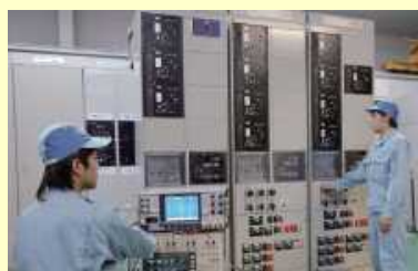
受配電盤の設計・製作及び据付