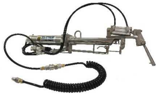
ミスターテンドー