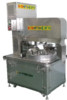
せせり自動切剥機