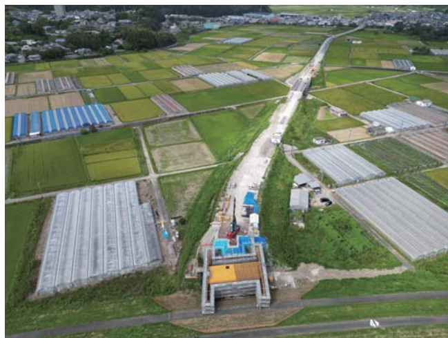
木脇高岡線 太田原工区