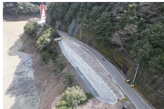
国道219号 越野尾二之渡工区