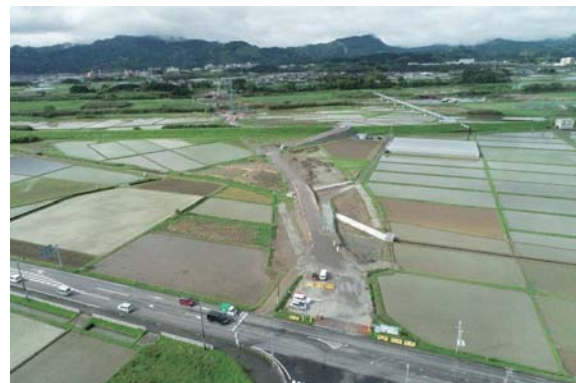
学園木花台本郷北方線 山下工区