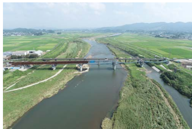
高城山田線 王子橋