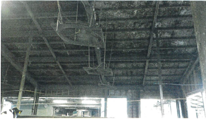
インバーターファン(東側)