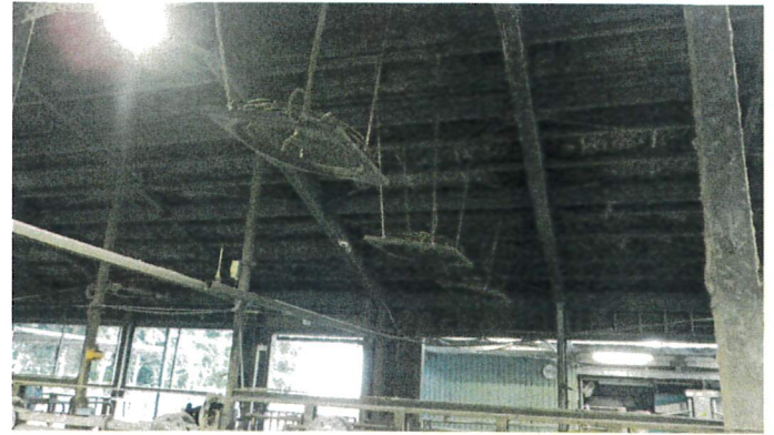
インバーターファン(中東側)