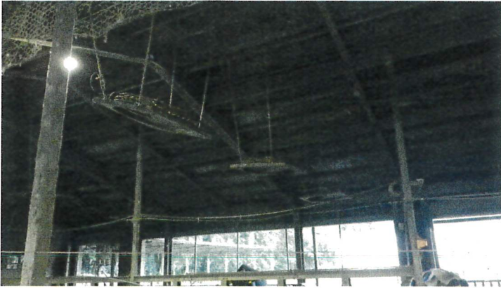
インバーターファン(中西側)