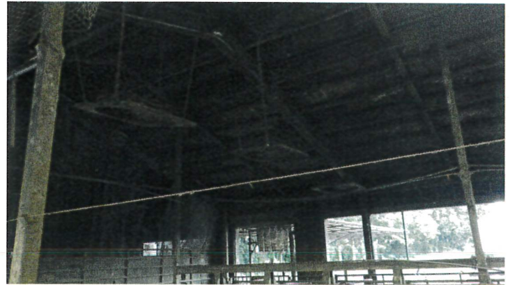
インバーターファン(西側)