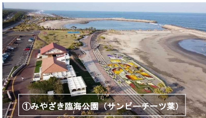
①みやざき臨海公園 (サンビーチテラス)