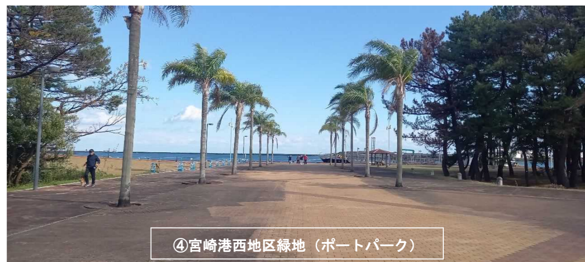
④宮崎港西地区緑地 (ポートパーク)