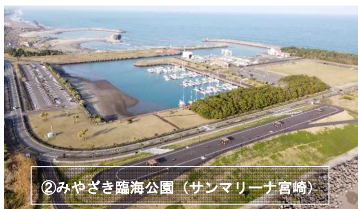
②みやざき臨海公園 (サンマリーナ宮崎)