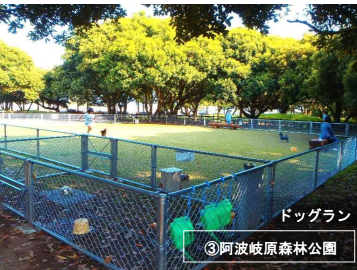
ドッグラン ③阿波岐原森林公園