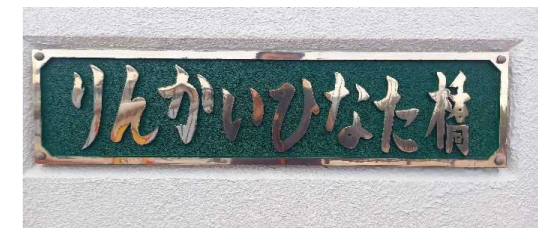
宮崎港小6年 田畑 志竜