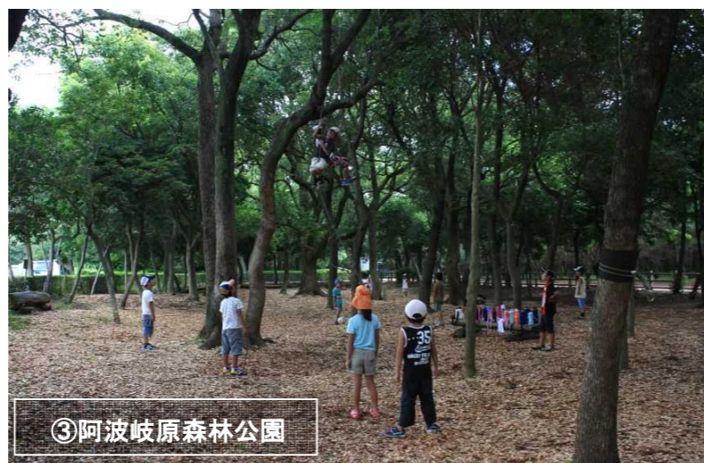
③阿波岐原森林公園