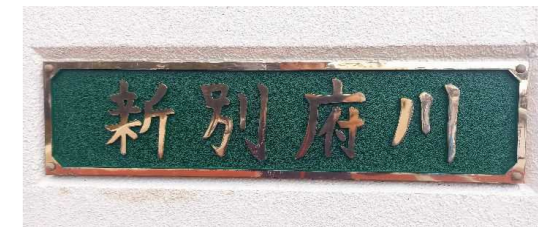
宮崎港小6年 川口 楓