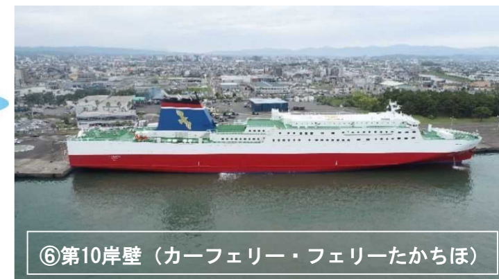
⑥第10岸壁 (カーフェリー・フェリーたちほ)