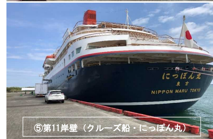
⑤第11岸壁 (クルーズ船・にっぽん丸)