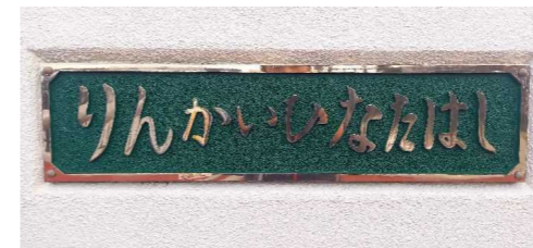
宮崎港小6年 丸山 侑真