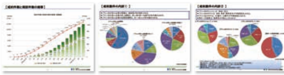
(本資料の著作権は、プロフェッショナル人材戦略全国事務局の統括マネージャー田中様に帰属します。)

宮崎県の成約事例として紹介されている企業、ならびにプロフェッショナル人材戦略拠点マネージャーにパネリストとして参加頂き、取り組み企業の生の声をお伝えしました。