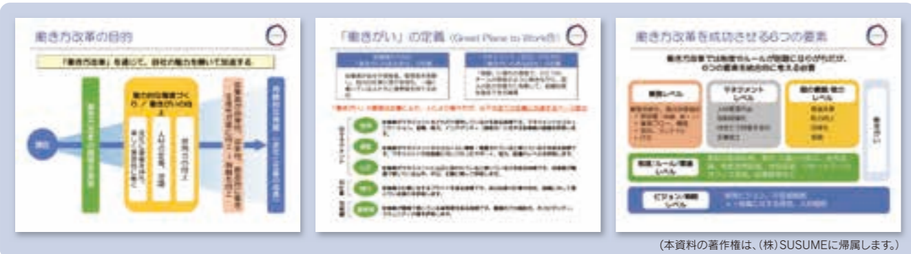
(本資料の著作権は、(株)SUSUMEに帰属します。)

総括 ●働き方改革の定番対策(長時間労働削減、有給取得促進、女性活躍、育児介護支援、シニア活用など)だけで会社は変わらない