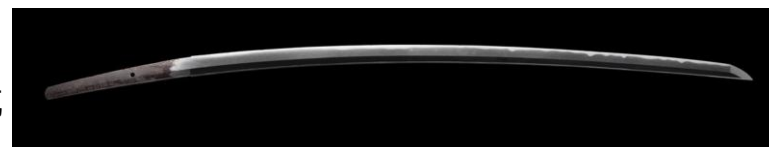
刀（表銘：日州古屋之住国廣作、裏銘：天正五年十月吉日）画像