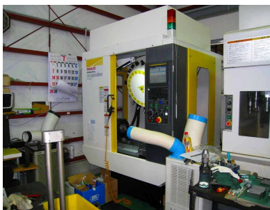
ロボドリルα-D21MiB5 (金属・プラスチック等の材料を切削加工する)