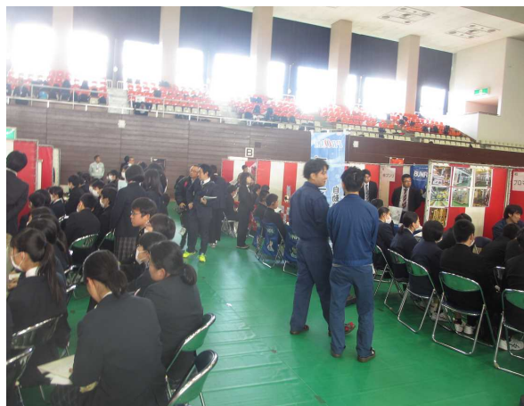
高校生企業ガイダンス