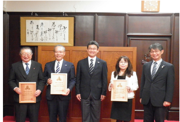
中小企業大賞知事表彰