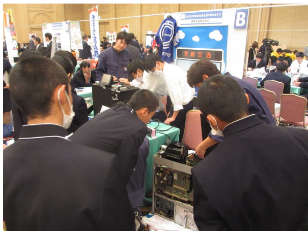
県内就職進学体験フェア