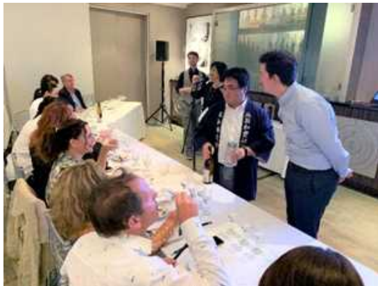
北米での焼酎試飲会