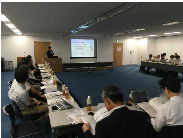
ICT企業首都圏商談会

【主な実績】 ひなたテラスin新宿サザンテラス 宮崎の焼酎と食のフェア（10店舗） 神戸ベイシェラトン 九州・熊本&みやざきフェア 宮崎マルシェ2020in福岡