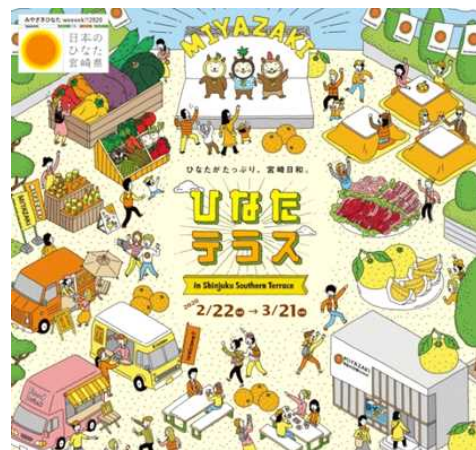
ひなたテラスin新宿サザンテラスポスター