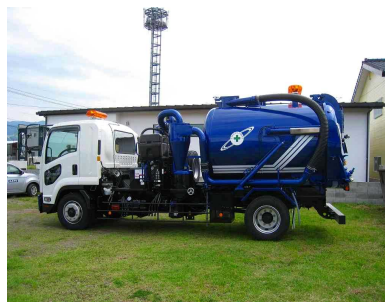
万能吸引車 (下水等の吸引を行う)