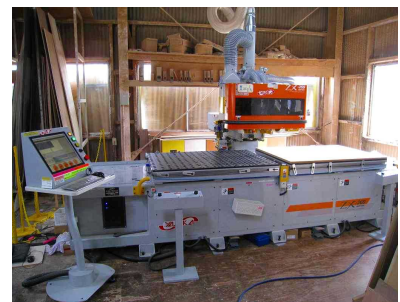
PNC複合ボーリングマシン (木材の鋸加工・くりぬき加工等を行う)